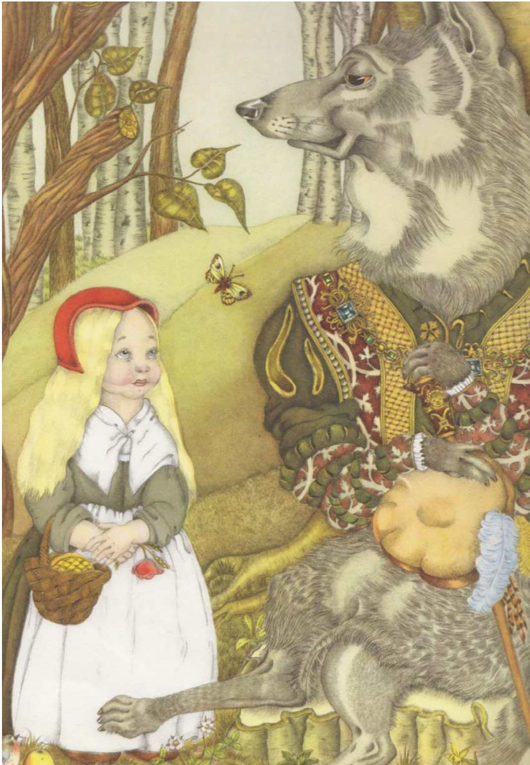
« Le Petit chaperon rouge », illustration d'Adrienne Ségur, extraite de l'ouvrage Il était une fois , Flammarion, Paris, 1951.