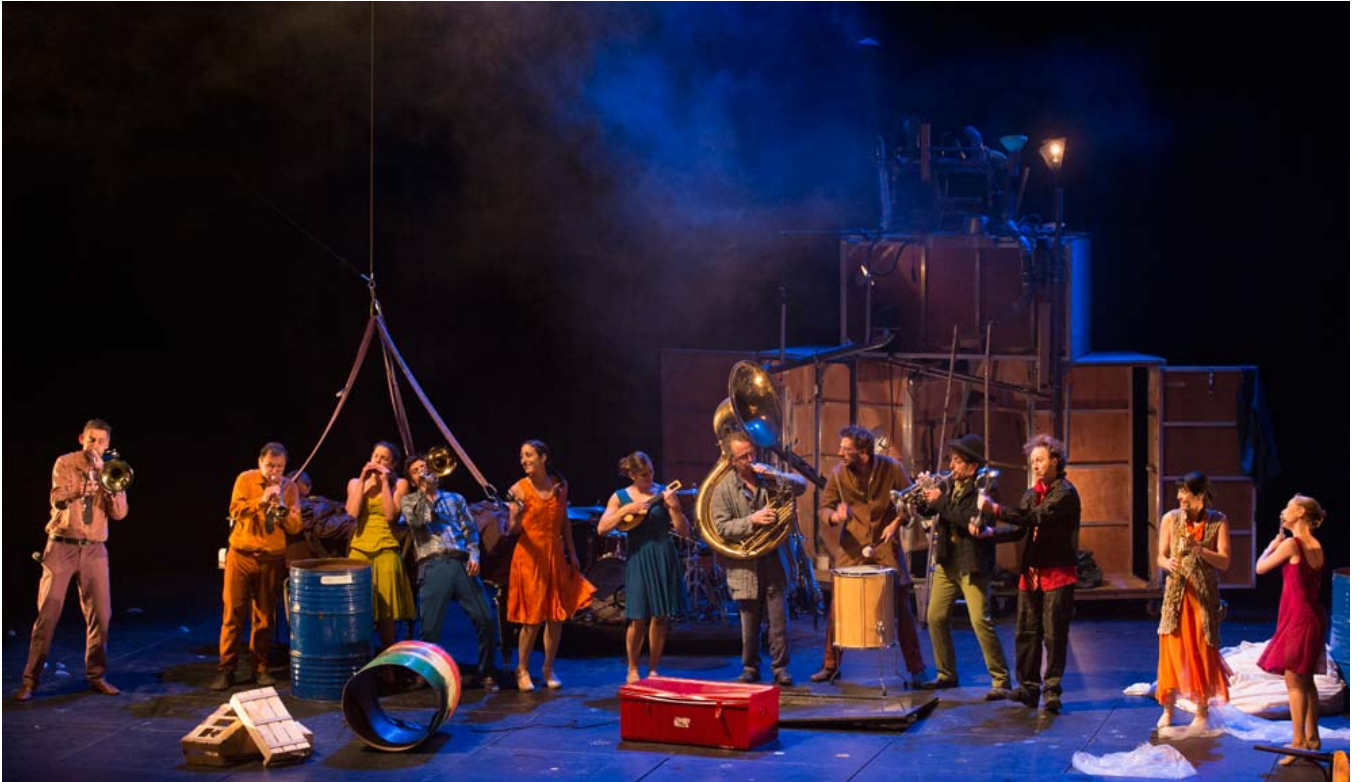
Tempus fugit , Cirque Plume, photographie d'Yves Petit, site officiel de la compagnie, 2013.