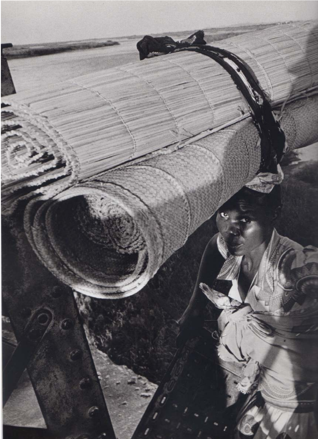
« Femme africaine », photographie de Sebastião Salgado, extraite de Exodes , La Martinière, Paris, 2000.