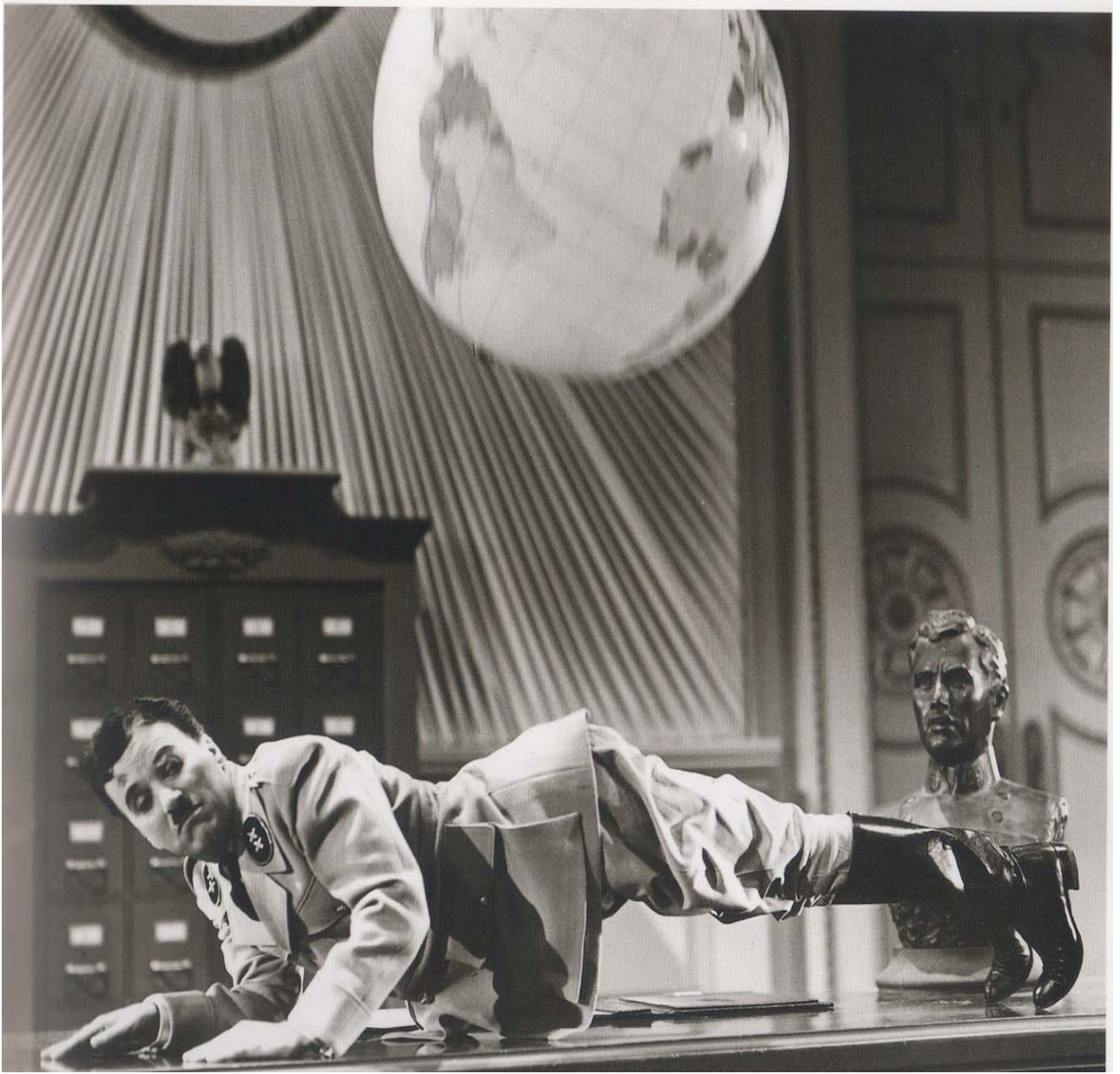
Image tirée du film Le Dictateur , Charlie Chaplin, 1940, extraite du livre Chaplin et les images , NBC Editions, Paris, 2005.