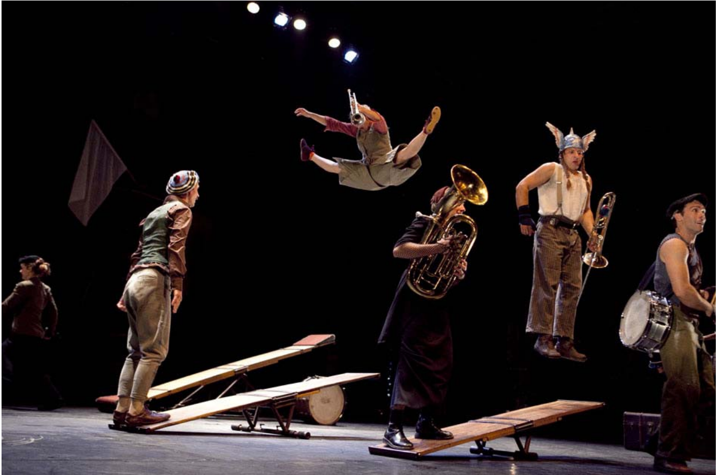
Fanfarerie Nationale, Collectif Cheptel Aleikoum, Cirque Fanfare Circa Tsuica, photographie de Gaël Guyon, extraite du site de Gaël Guyon, 2010.