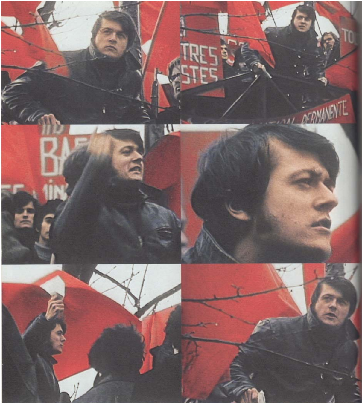
Images tirées du film Trotzky , Jacques Kébadian, 1967, avec le comédien Patrice Chéreau, extraites de Patrice Chéreau un musée imaginaire , Actes Sud, Arles, 2015.